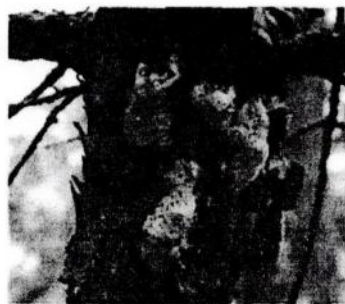
Obrázok 2. Staré znášky (4 ks), ktoré sú už bez vajíčok a preto sa nezarúľavaju. Majú svetlo okrovú farbu. Po dotyku prstom sú mäkké. Na povrchu bývajú viditeľné maličké otvory, ktoré zanechali húsenice, ktoré sa z nich vyliahli.

Kontrola sa vykonáva v cerových, dubových a zmiešaných porastoch - v každom lesnom komplexe so zastúpením duba a cera nad 50 %, a to najmä v porastoch slt. Carpineto-Quercetum a v dubovo hrabových porastoch a topoľových plantážach. Postupovať podľa STN 48 2715.